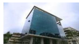
弊社インド(ブネ)拠点

本セミナーが「グローバル人材」の育成の一助となれば幸いです。 皆様のご来場を心よりお待ちしております。